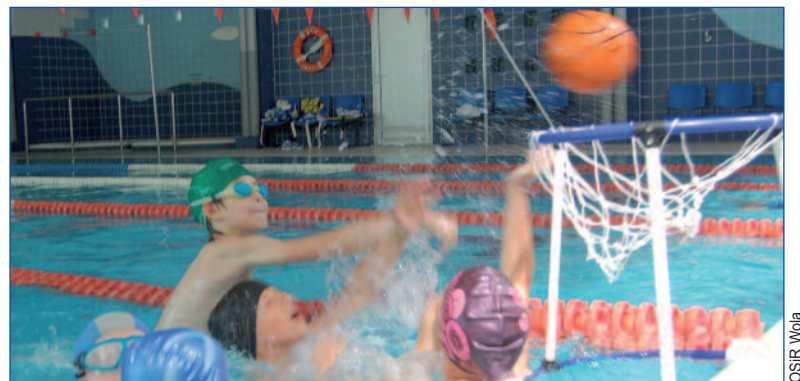
Pływanie, rekreacja i sauna – już od 6.00 rano „Foka” czeka na mieszkańców