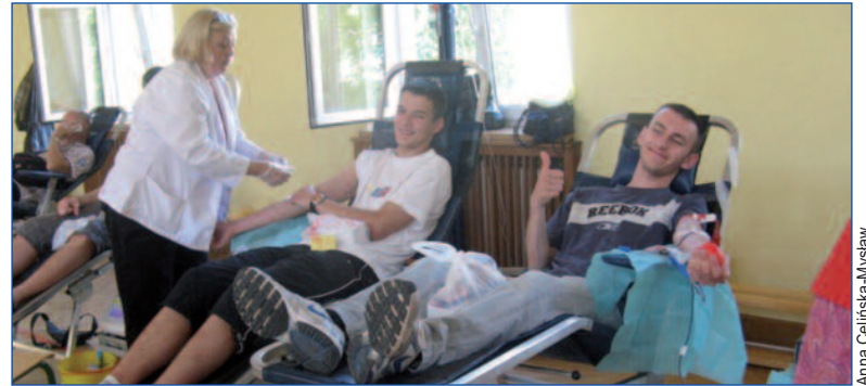
Zbiórka krwi 6 czerwca 2011 r. w Zespole Szkół im. Marcina Kasprzaka