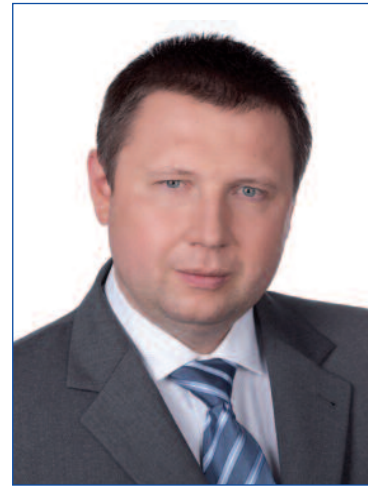
Wicemarszałek Województwa Mazowieckiego Marcin Kierwiński

licja i straż miejska aktywnie włączają się w nasze wspólne działania, ponieważ daje to uczniom możliwość spotkania się z fachowcami w dziedzinie bezpieczeństwa. Żeby uatrakcyjnić te zajęcia i lepiej utrwalić wiadomości, uczniowie otrzymają elementarz „Z Borsukiem bezpieczniej” – przygotowany specjalnie z myślą o nich przez Wydział Prewencji Komendy Stołecznej Policji i Urząd Dzielnicy Wola – oraz sfinansowane przez Urząd Województwa Mazowieckiego breloczki odbłaskowe, których zadaniem jest zwiększenie widoczności dziecka w ruchu ulicznym. Wola to dzielnica położona w centrum wielkiego miasta. Dzieci powinny być tu w sposób szczególny uwrażliwione na zagrożenia związane z ruchem ulicznym. Rozmowa w szkole, elementarz do zabawy w domu i odbłaskowa zawieszka to wstęp do codziennej pracy z najmłodszymi, by