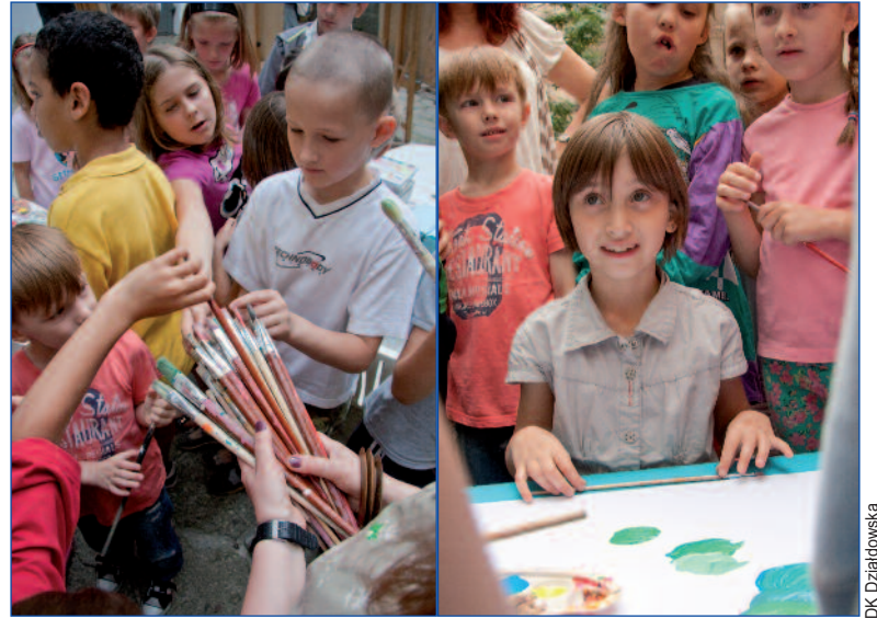
Wakacyjne malarstwo w plenerze z DK Działdowska. Na rok szkolny dom kultury szykuje warsztaty z fotografii tradycyjnej

Również w niedzielę, ale nieco wcześniej, bo w godz. 9.00-15.00, na dzień otwarty przy ul. Brożka 1a zapra-